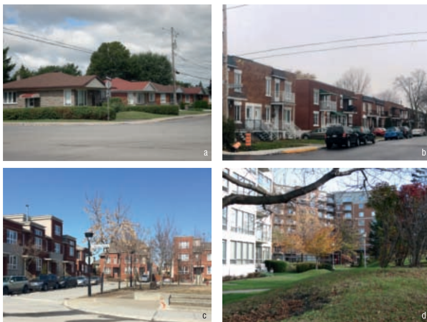
Figure 4 > Environnements résidentiels métropolitains