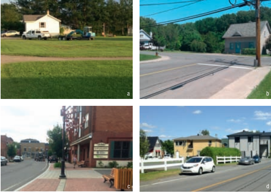
Figure 3 > Environnements résidentiels non métropolitains